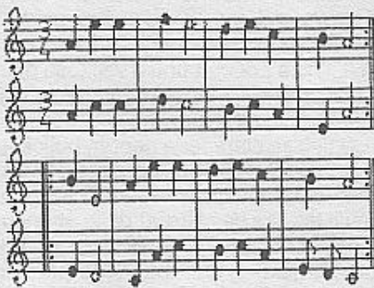
Toto znaménko se jmenuje repetice